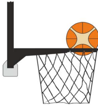
圖 4: 球在球籃中

31-24 範例：A1 試投 2 分。當球在籃圈上旋轉且有最小一部分在球籃中或低於籃圈的平面時，