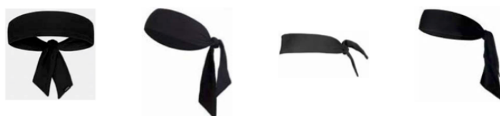
圖 1: 頭巾式頭帶範例