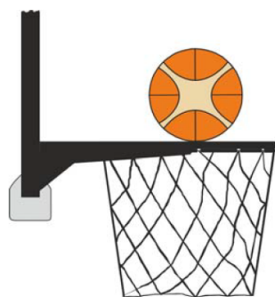
圖 3: 球正與籃圈接觸

31-18 說明：在投籃時，若一防守或進攻球員在球正與籃圈接觸且仍有中籃可能時觸及球籃（籃圈或籃網）或籃板，這是干擾球違例。